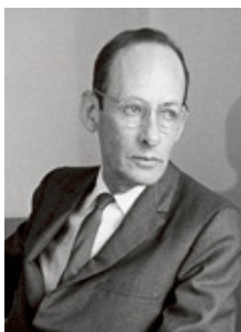
ฟิลิป ฟิชเชอร์ (Philip Arthur Fisher)

“หากการวิเคราะห์บริษัท ถูกทำอย่างถูกต้องสมบูรณ์ จนได้หุ้นเข้ามาอยู่ในพอร์ตแล้ว แทบไม่ต้องสนใจเรื่องการขายอีกเลย”